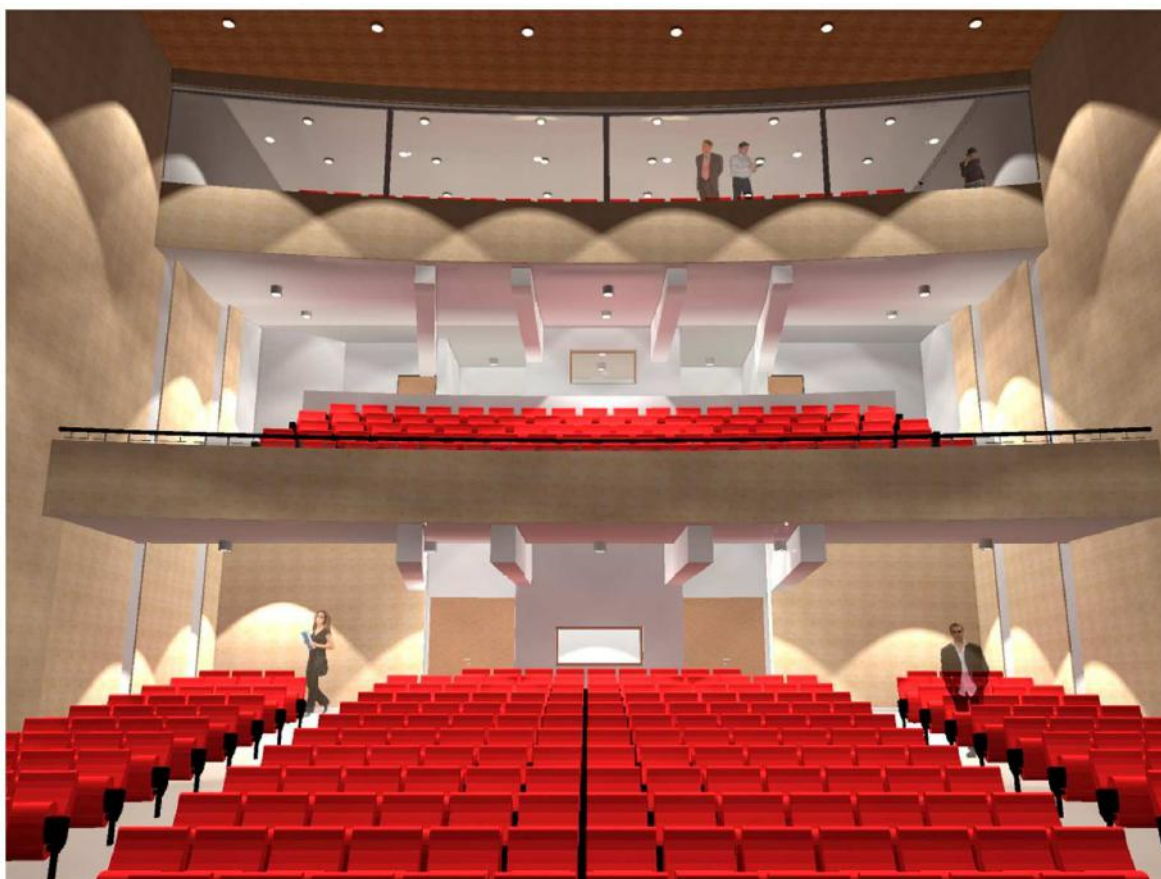
VISTA SALA ARTES ESCÉNICAS

Este Proyecto se encuentra postulado a Ejecución, solicitando M$1.322.703 a fuente de financiamiento FNDR como parte del Programa de Recuperación de Teatros Patrimoniales de la provincia de Malleco.