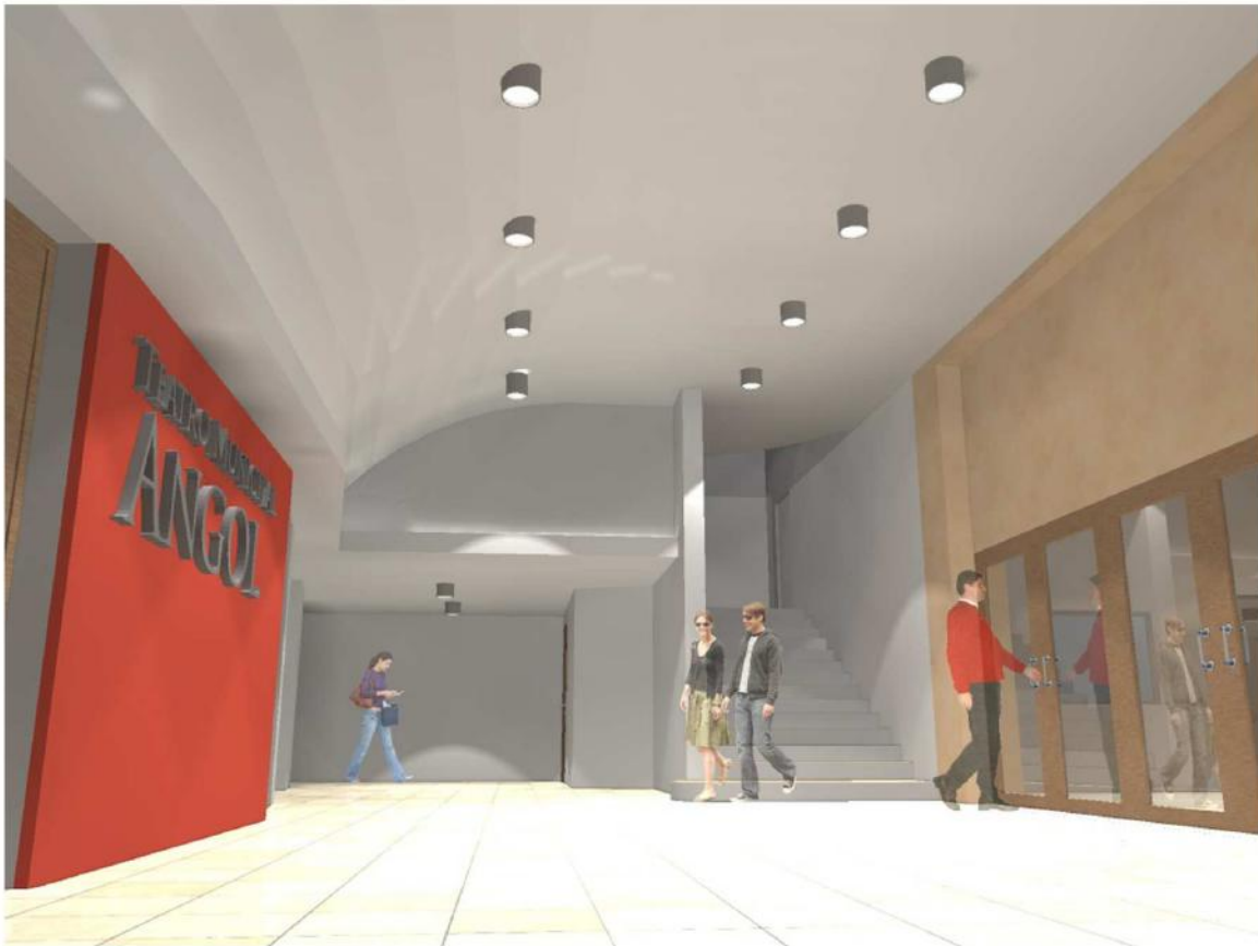
VISTA HALL ACCESO